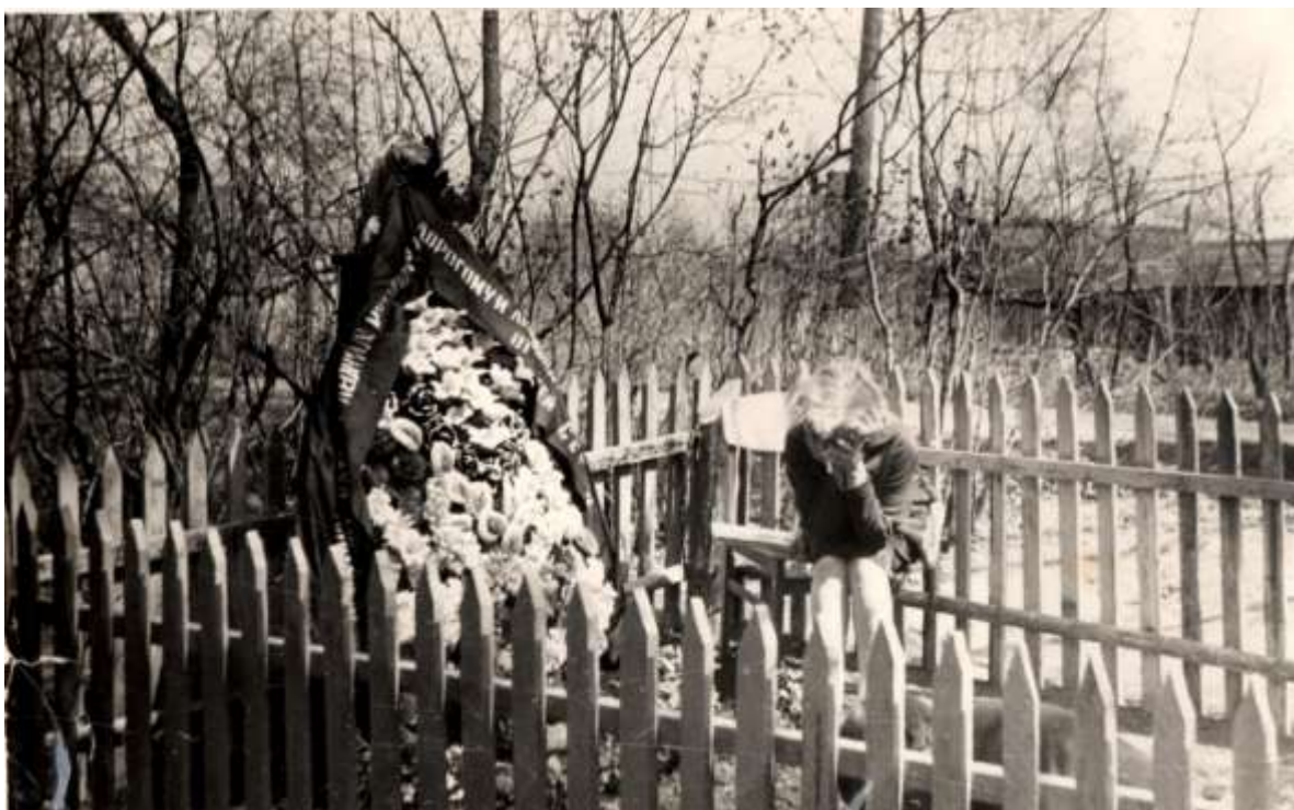
3. Встреча дочери с отцом через 28 лет. 9 мая 1969 год