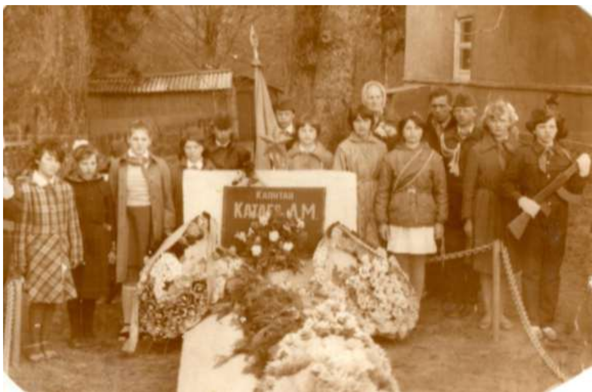
9 мая 1985 год