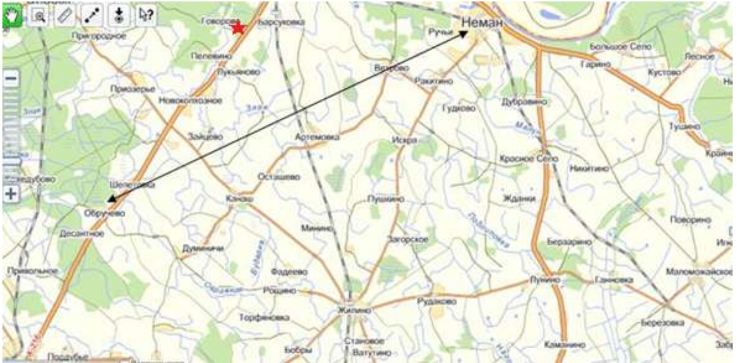
1. Карта Неманского района ★ Место обелиска в п. Говорово