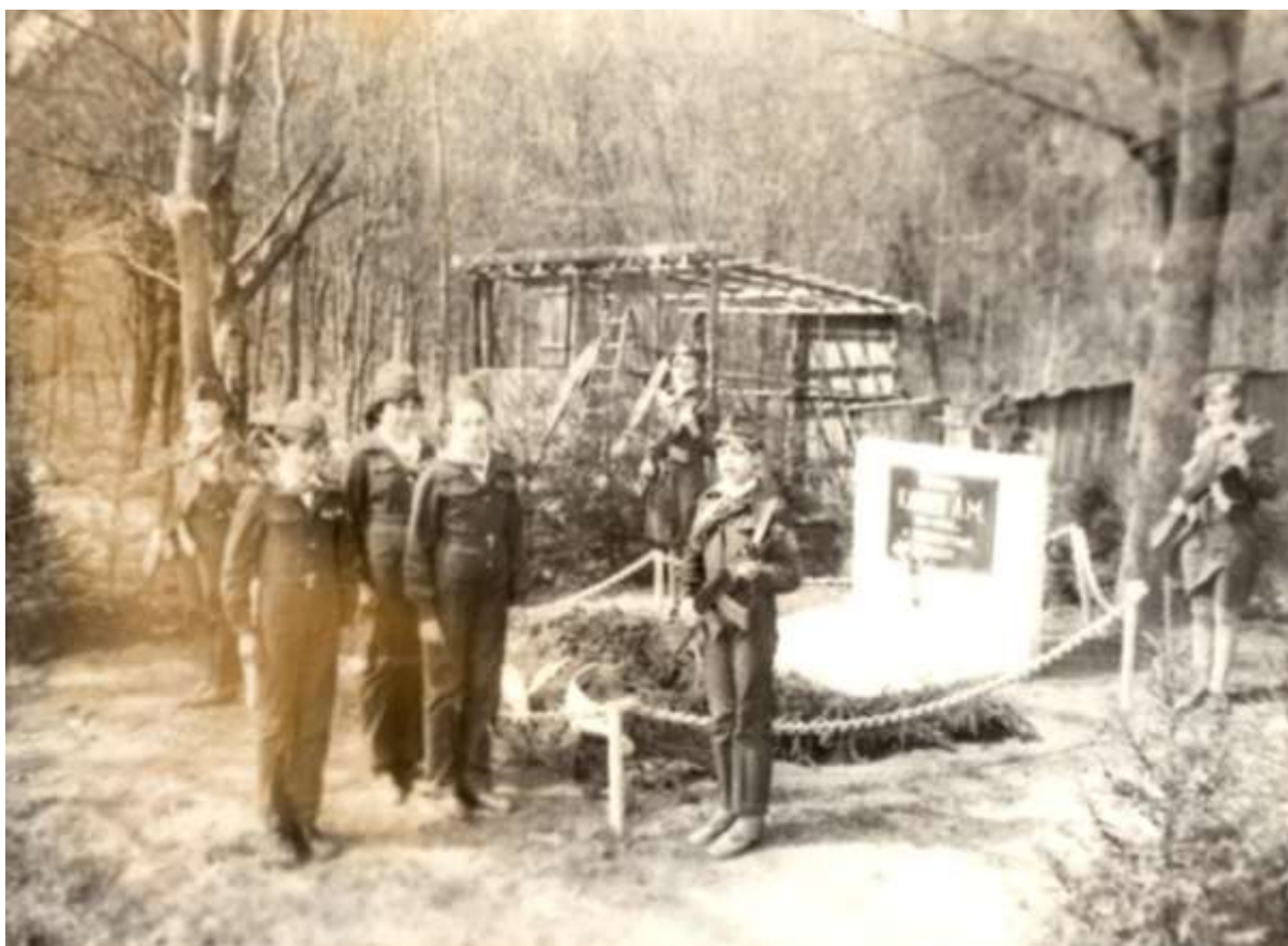
5. 9 мая 1988 год. Почетный караул юнармейцев у памятника