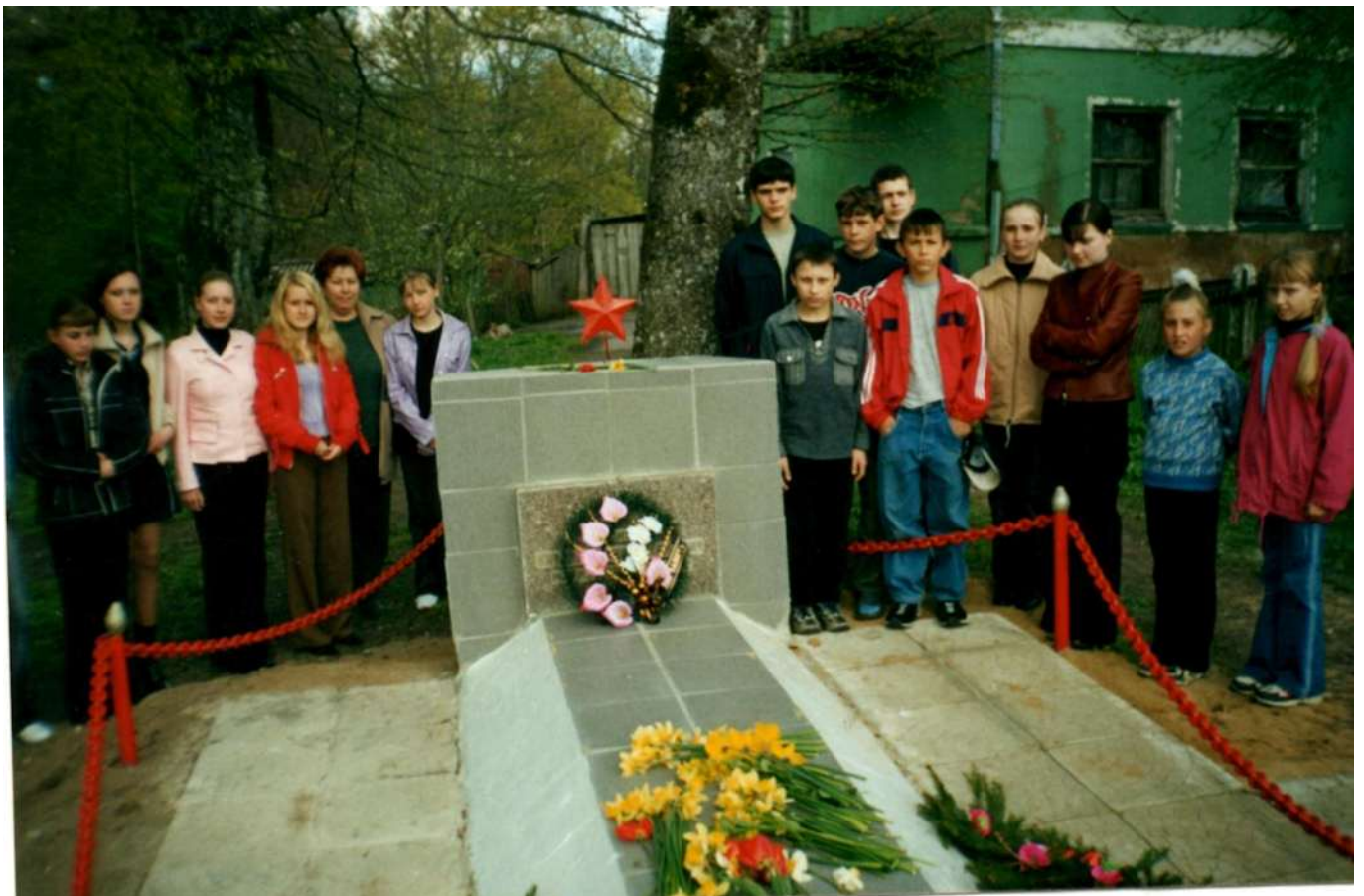
9 мая 2000 год. Минута молчания