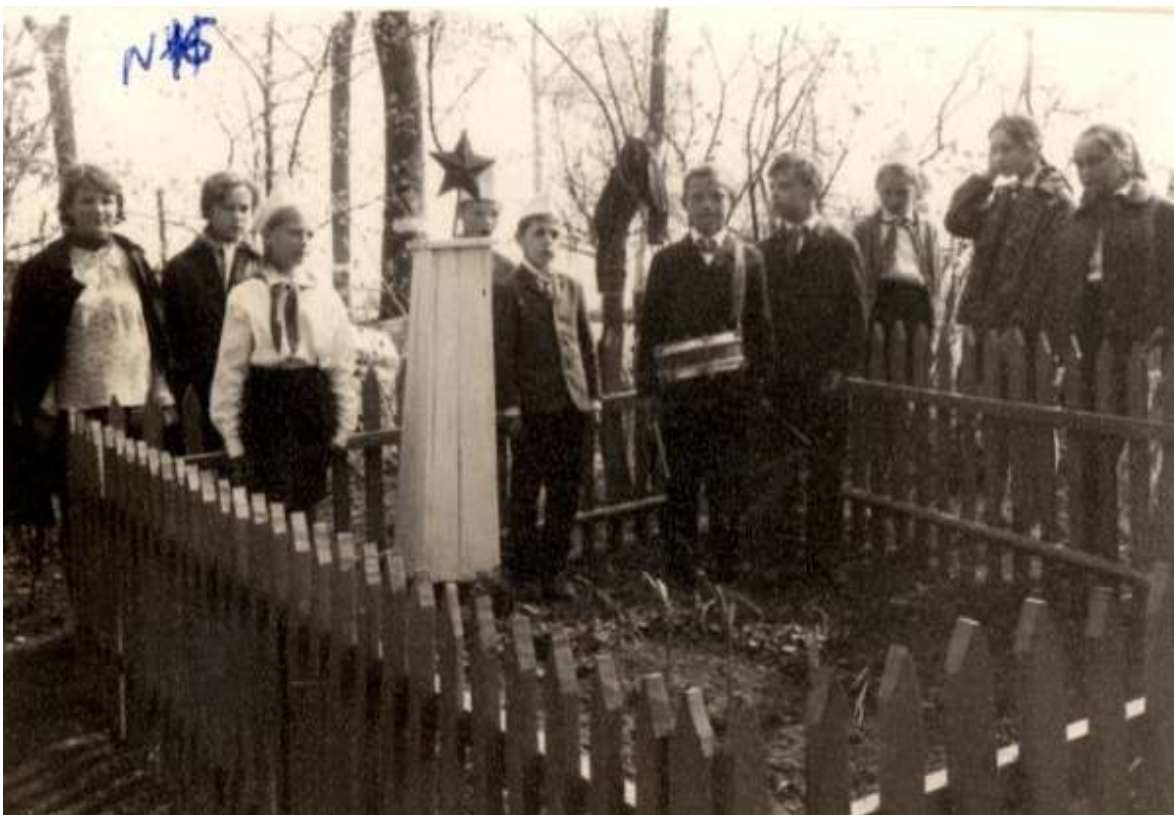
2. Первый памятник капитану Л. М. Катаеву и неизвестному солдату. 1969 год