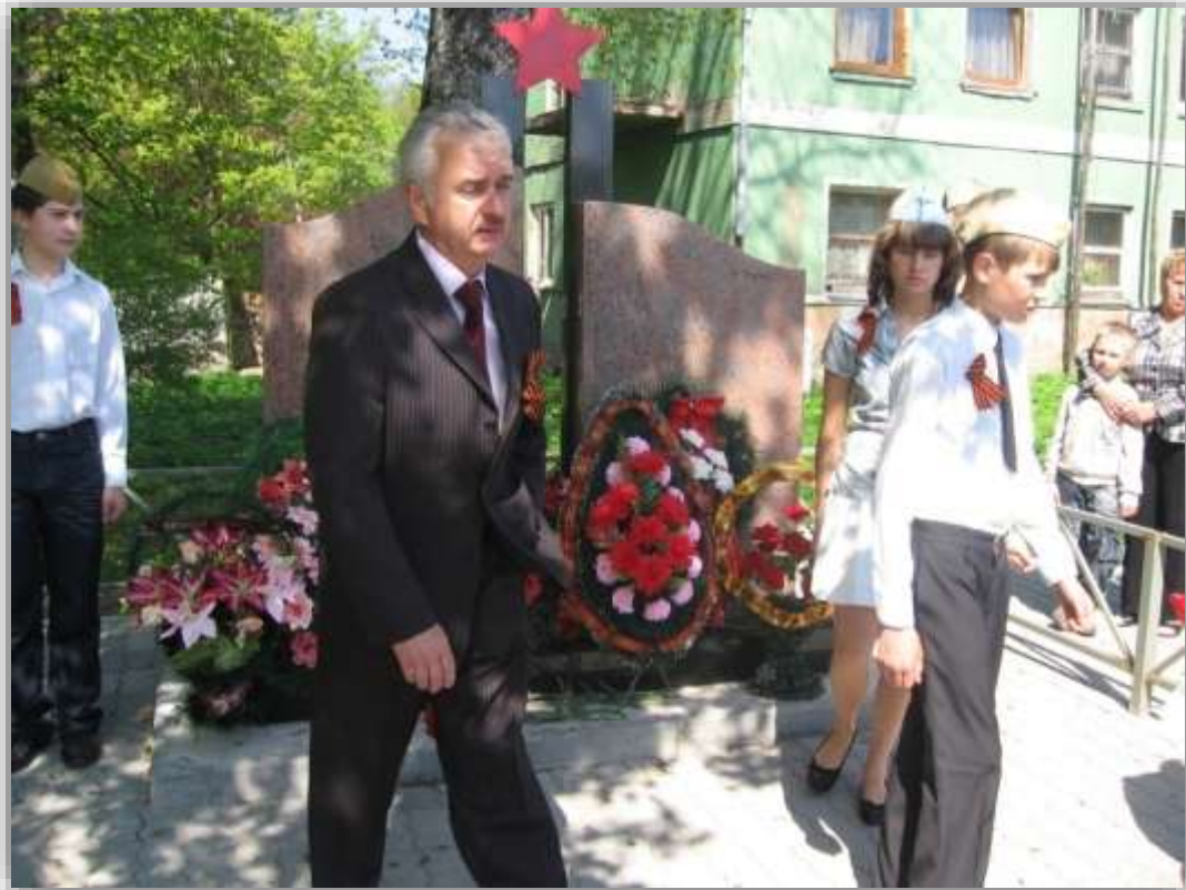
6. 9 мая 2010 года - день открытия реконструированного обелиска в п. Говорово