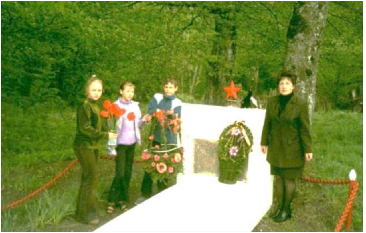
Май 1998 год